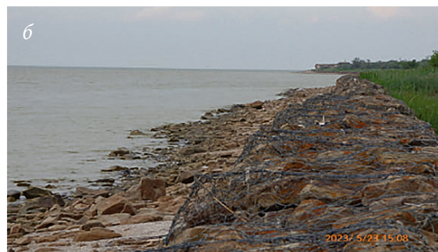
Рис. 10. Берегозащита прикорневой части Чумбурской косы: а) современное состояние, б) состояние коробчатых габионов 2018 г.

Публикация подготовлена в рамках научно-исследовательской работы ЮНЦ РАН «Комплексное обследование прибрежной территории береговой линии Таганрогского залива Азовского моря».