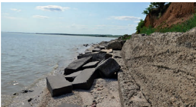
Рис. 1. Берегоукрепление в районе с. Весело-Вознесеновка, спортивно-оздоровительный лагерь «Ивушка»

Отмечаются дефекты бетона: разрушен полностью, каменная постель отсутствует полностью. На разрушенных конструкциях отмечены выбоины, трещины, арматура, отдельные блоки пере-