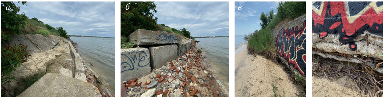
Рис. 7. Берегозащита в районе с. Петрушино

от друга. Нижний ряд сильно просажен, деформирован. Стенка разрушена, особенно западная оконечность бетонного откоса (рис. 8). Бетон частично разрушен, отмечаются выбоины, трещины. Откос разрушен, проваливается. Отдельные блоки отклоняются от общего положения на 10–15°. Состояние сооружения аварийное.