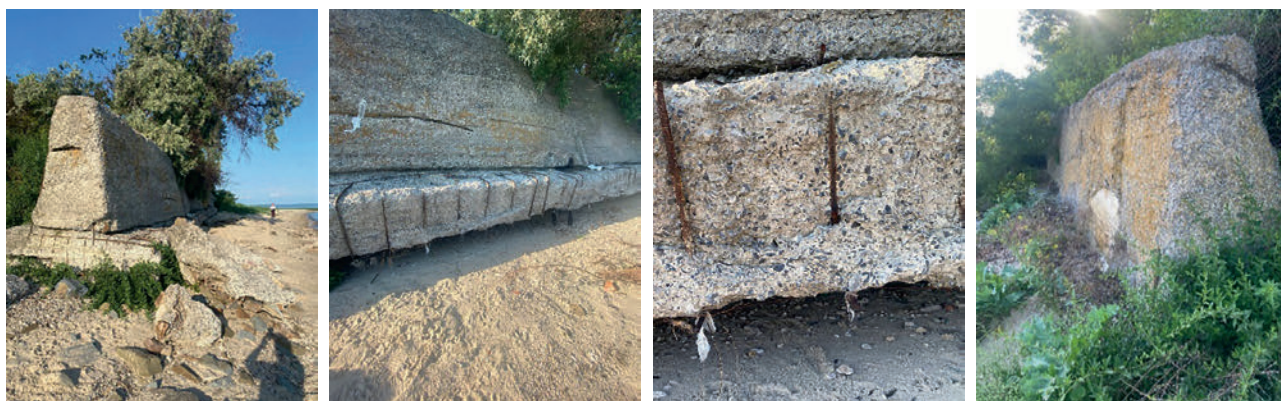
Рис. 5. Разрушенная волноотбойная подпорная железобетонная стенка в районе п. Красный Десант

Верхний ряд представлен отдельными блоками, разошедшимися на расстоянии 20 см друг