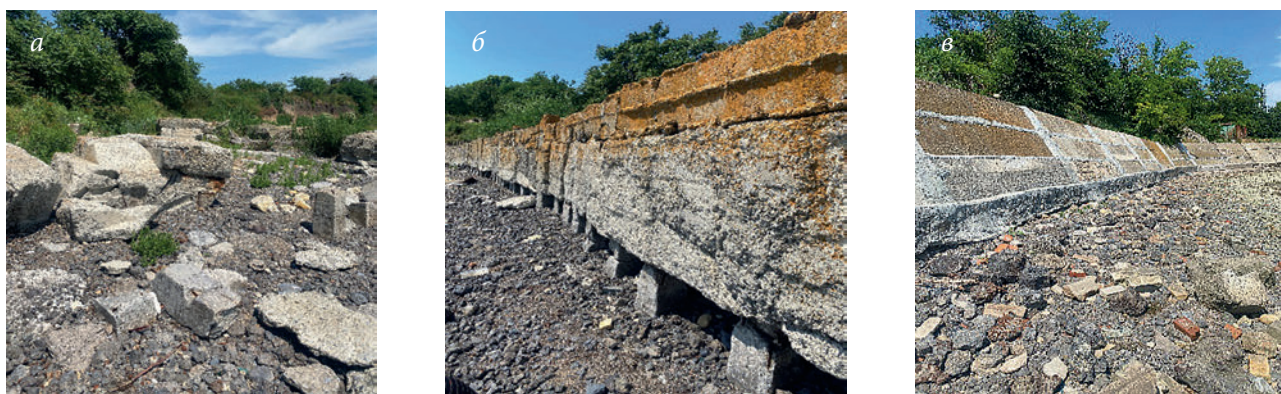
Рис. 3. Состояние берегозащиты на первом (а), втором (б), третьем (в) участках

части), трещины, выбоины. На стенке видны деформации конструкции в виде выбоин и глубоких диагональных трещин (рис. 4а).