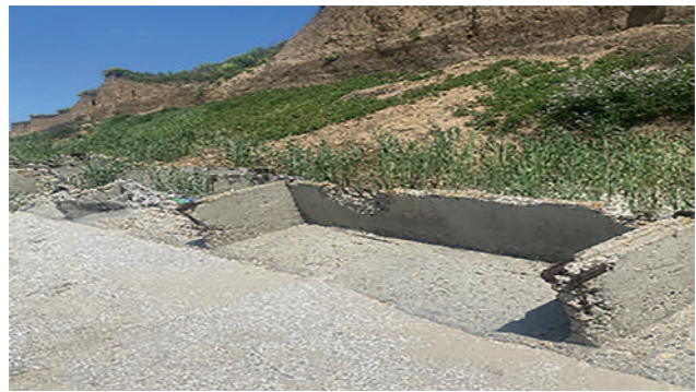
Рис. 2. Берегозащита из П-образных блоков на аварийном участке в прикорневой части Беглицкой косы

вернуты и хаотично разбросаны по пляжу. Состояние сооружения полностью аварийное.