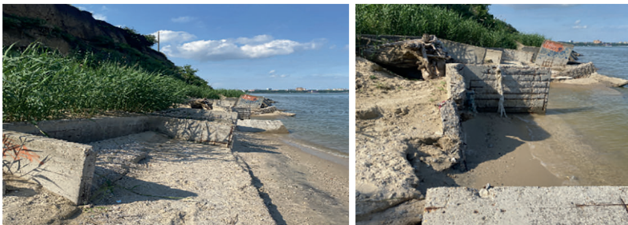
Рис. 6. Берегозащита в виде П-образной стенки