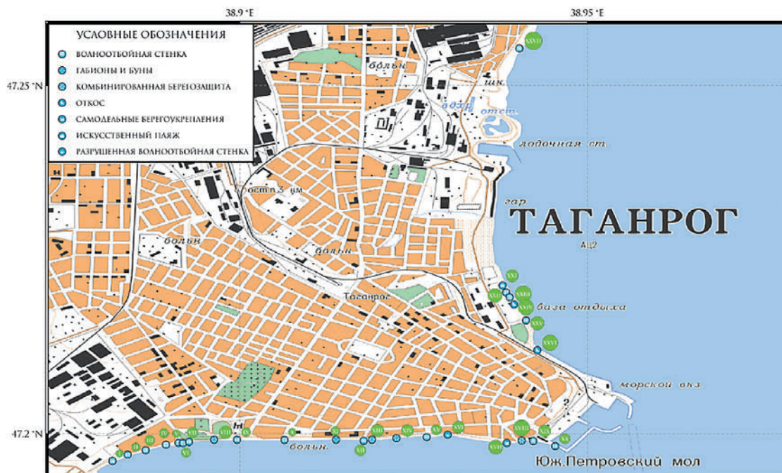
Рис. 9. Карта размещения берегозащитных сооружений в г. Таганроге