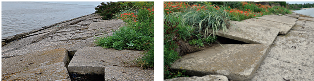
Рис. 8. Разрушенная берегозащита на восточной окраине с. Петрушино

На южном побережье Таганрогского залива берегозащита представлена на прикорневой